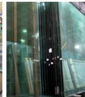
Okna iz umetne mase in lesa z aluminijasto oblogo ter proizvodnja izolacijskega stekla: s permanentno investicijo vedno najsodobnejše stanje tehnologije.

Internorm, pionir na področju oken iz umetne mase, kot edini proizvajalec oken obvlada » celoten koncept sistem oken «- od raziskav in razvoja, lastnega ekstrudiranja, proizvodnje stekla in sodobnih proizvodnih tehnologij do logistike. Zaradi neodvisnosti od dobaviteljev Internorm razvija lastne dizajne kril in okvirjev ter individualne sisteme okovja.