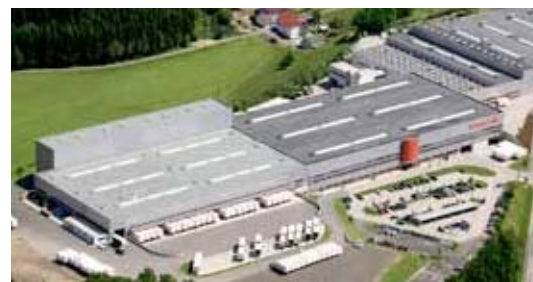
Sarleinsbach/Gornja Avstrija: proizvodnja oken iz umetne mase in umetne mase z aluminijasto oblogo, izolacijskega stekla in ekstrudiranje

Vsak izdelek je narejen po meri - vsako okno, vsaka vrata se izdelajo natanko po vaših željah in so označena z identifikacijsko številko - »Identity Nr.«