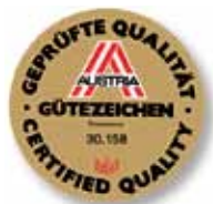
Kakovostna znamka Avstrije