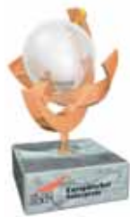
Evropska solarna nagrada (projekt Solanova)