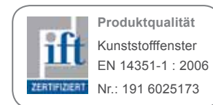
Inštitut za okensko tehniko Rosenheim