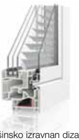
površinsko izravnan dizajn