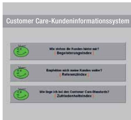
sistem informiranja kupcev Customer Care

S številnimi sejmi, informacijskimi prireditvami, akcijami za pospeševanje prodaje, obsežnim programom Customer Care, letno novim izobraževalnim programom v okviru Internormove partnerske akademije boste vedno na tekočem.