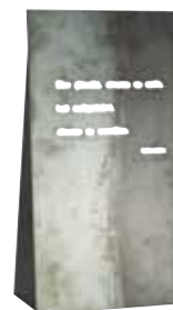
Austria's Leading Companies