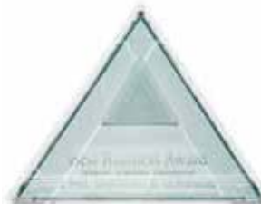
Poslovno priznanje Best Business Award