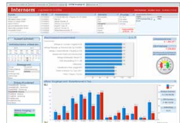
[1 st ] WINDOW SYSTEM