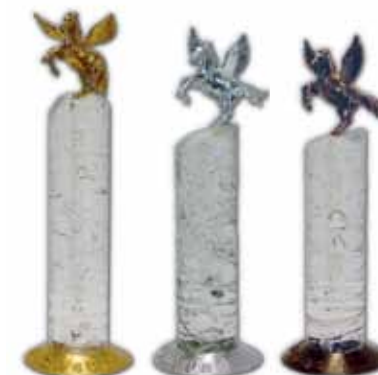
Zlati, srebrni in bronasti Pegaz