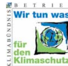
Zveza za podnebje občine Traun