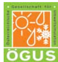
Avstrijska družba za simulacijo okolja