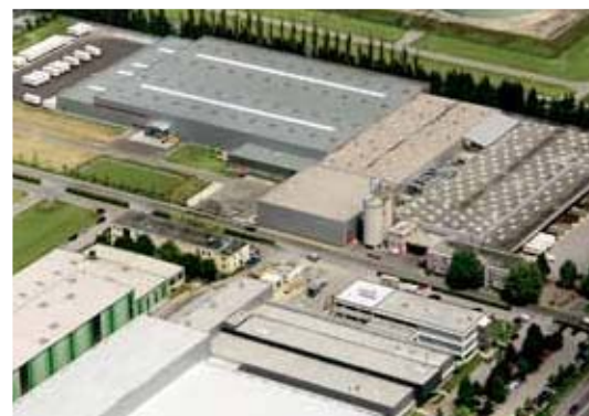
Lannach/Štajerska: proizvodnja lesenih oken z aluminijasto oblogo.