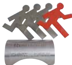
Priznanje za podjetništvo