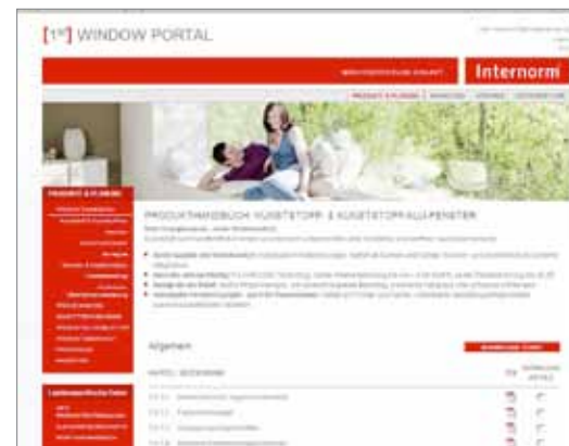
[1 st ] WINDOW PORTAL