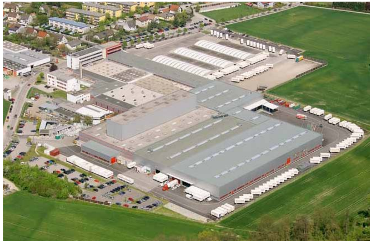
Traun/Gornja Avstrija: proizvodnja oken iz umetne mase ter umetne mase z aluminijasto oblogo, izolacijskega stekla in aluminija.

Vodilne v panogi, tehnološko napredne in dolgoročne rešitve - že 80 let. Kot vodilni na tržišču Internorm narekuje tempo in postavlja nova merila po vsej Evropi. Kakovostne izdelke, ki so 100-odstotno »made in Austria«, razvija in proizvaja v najsodobnejših tovarnah v Traunu, Sarleinsbachu in Lannachu.