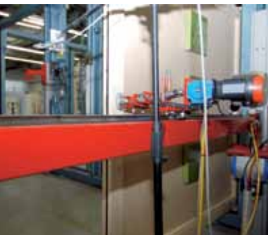
Preizkus: trajnost, tesnjenje pri nalivih, obstojnost na vremenske spremembe.